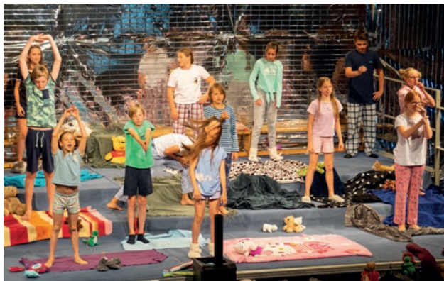
Wovon träumen Tintenfische? – Aufführung der Theaterklasse 2019

Hinweis: Die Einrichtung von Profil- und Wahlangeboten hängt von der Anzahl der interessierten Schülerinnen und Schüler sowie der verfügbaren Lehrkräfte ab.