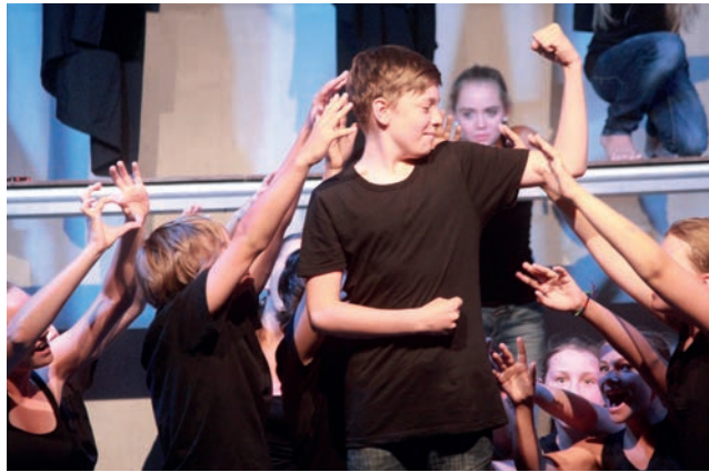
Stärkung der Selbstkompetenz mit Theater