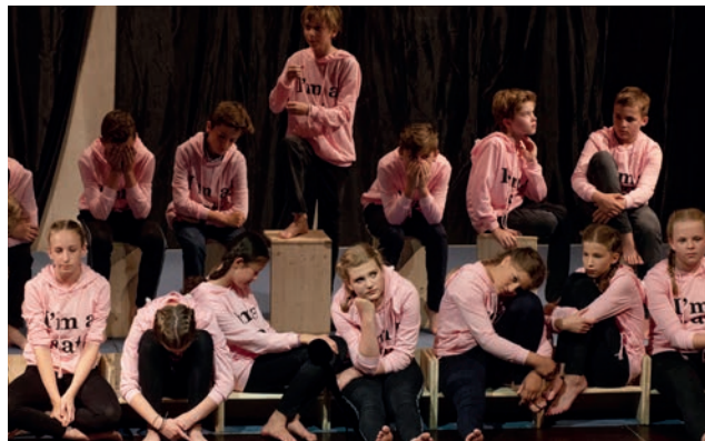
Wild wide world – Aufführung der Theaterklasse 2018